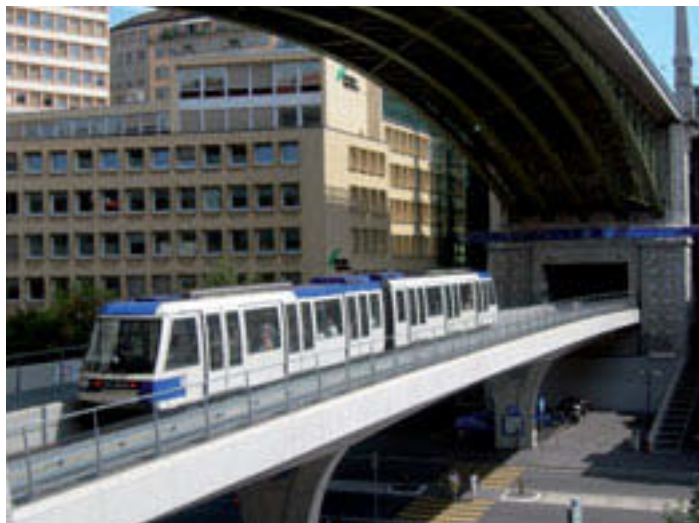
Grossstädtisch in Lausanne: Doppelwagen der Metro auf Pneu.

Ab den Sechzigerjahren ging jeder Verkehrsbetrieb punkto Beschaffung eigene Wege. Zürich setzte auf die (mirage-teuren) Doppelgelenkwagen, Basel postete günstige Düwag-Trams in Deutschland, Bern liess sehr starke Wagen entwickeln, welche mit unbequem steilem Einstieg brillierten. Genf – als