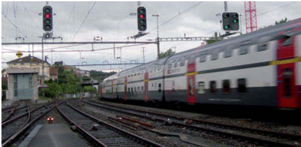
Effretikon: Wie viele Fernpendler sitzen in diesem IC St. Gallen–Genf?

Mehr Mobilität ist, wie bei anderen Gütern, eigentlich durch deren Nutzer zu bezahlen, ein ökonomischer Grundsatz. Für öV-Reisende existiert heute ein Kostenplafond: Der Preis des Generalabonnements, niemand bezahlt mehr. Zwar steigt der Preis im Dezember um 200 (2.) resp. 300 Franken (1.Klasse). Aber die Nutzung wird nicht beschränkt. Im Gegenteil. Dazu gekommen sind seit der letzten Preisanpassung neue Strecken (Rigi, Mals), Fahrplanverdichtungen, Spätzüge bis in alle Nacht. Über 400 000 GA werden pro Jahr verkauft. Wenn nur deren Inhaber und Inhaberinnen das öV-Angebot gleichmässig nutzen würden! Leider nein, das Fernpendeln nimmt überpro-