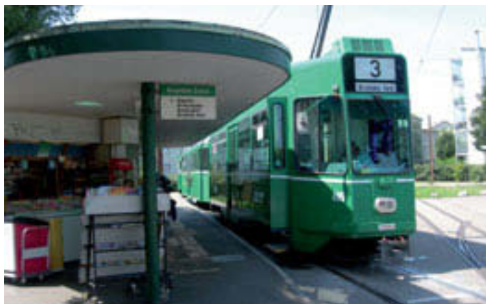
Der Dreier: bis Burgfelden Grenze oder durch Bourgfelden hindurch?

Die Verlängerung der Linie 11 durch die Avenue de Bâle bis zum Bahnhofplatz von St-Louis wurde auf Verlangen dieser Stadt als Option bis nach 2018 zurückgestellt und das Projekt via Bourgfelden vorgezogen.