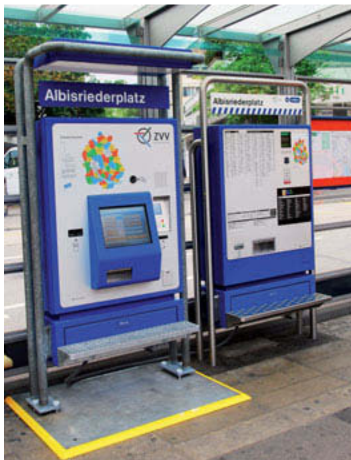
Mit Bildschirm oder mit Tasten, welcher ist besser?

Kompliziert bleibt die Frage, ob als Ziel eine Zone oder eine Destination einzugeben ist. Wer in Eglisau nach Zürich will, dem lacht auf dem Bildschirm das Ziel Zürich HB entgegen. Mist, denn für ein ZVV-Billett der Zone Zürich ist für alle Bahnhöfe und Tramhaltestellen der gleiche Preis gültig. Auf dem Billett, das der Automat daraufhin ausgibt, steht dafür «gültig in den Zonen 10, 12, 13, 21», womit ich mit Tram oder SZU ins Triemli fahren kann. SBB- und ZVV-Automaten listen unter dem Buchstaben Z über dreissig verschiedene Zürcher Bahnhöfe/Haltestellen auf. Ein Unsinn, besser wäre der fiktive Zielbahnhof «Zürich, ganzes Stadtgebiet», so, wie auf den alten Tastenautomaten. Im HB Zürich stehen SBB- und ZVV-Automaten friedlich Seite an Seite. Praktisch alles gleich, doch das ZVV-Modell weiss offenbar nicht, wo es steht, dort muss zuerst der Abgangsort eingegeben werden, im Gegensatz zum SBB-Modell, das ohne Weiteres ein Billett ab Zürich HB ausspeit.