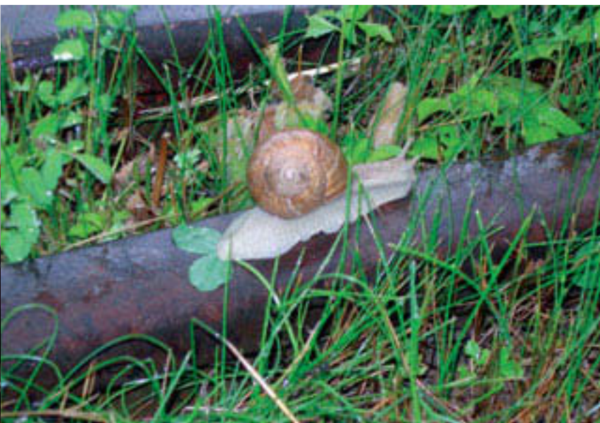
Mobility Pricing auf Spitzenstrecken, wohl nicht für solche «Schienen-Pendler».

deln. Für viele – speziell Seniorinnen und Senioren – wird das GA als angenehmer Luxus, als Schlüssel zur Mobilität verstanden und ermöglicht auch den Verzicht aufs Auto. Das ruft bei einer überproportionalen Preiserhöhung beim GA Protest hervor. Die Idee des 9-Uhr-GA (Mo-Fr erst ab 9 Uhr gültig, Sa, So unbeschränkt) bietet sich als Ausweg an. Touristisch ausgerichtete Bahnen (Rhätische Bahn, Golden-Pass) können dieser Idee nichts abgewinnen. Verständlich, denn deren Spitzen sind nicht werktags von 6 bis 8 Uhr, sondern am Wochenende zwischen 9 und 17 Uhr. Aus einem günstigeren GA resultiert dort ein kleinerer Ertrag, ohne irgendwelche Möglichkeit zur Kosteneinsparung.