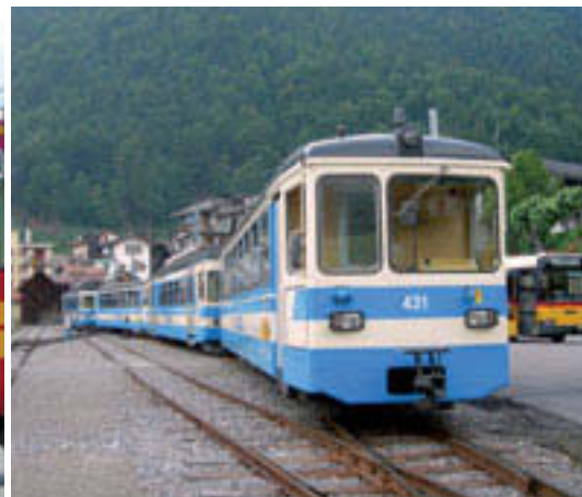
Im Uhrzeigersinn von links oben: Aigle: TPC und Bus warten. Champéry mit Anschluss in die Portes de Soleil. Doppelspurig nach Leysin. Im Val d'Illeiez. Zugskreuzung in Le Sepey. Bex TPC mit Perronhöhe null. Moderner Bahnhof in Aigle. AL als Strassenbahn durch das Städtchen.