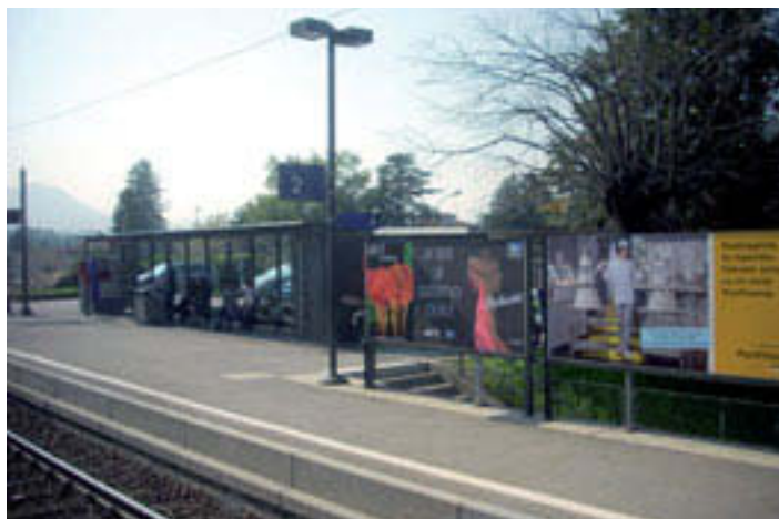
Lamone: Migliorare l'interscambio TiLo – Autopostale.

Un esempio: fino al 2006 da Bedano si raggiungeva la città in 15 min. La durata del percorso era calcolata in modo da avere coincidenze immediate a Lamone e il tempo previsto corrispondeva alla durata reale del percorso. Nel Luganese il servi-