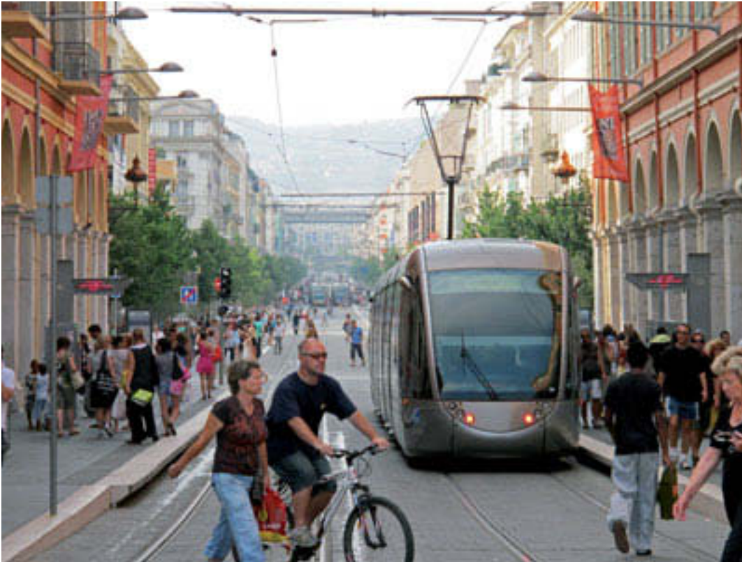
Avenue Jean Medecin und Place Masséna: mit und ohne Fahrleitung.