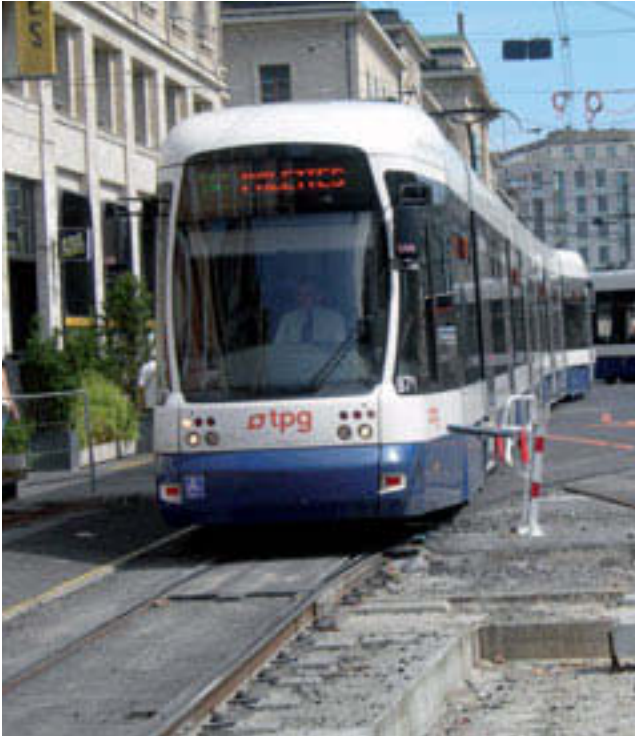
Cornavin: Nichts als Baustellen.

Auf den massiven Ausbau des Tramnetzes soll eine Vereinfachung des Liniennetzes erfolgen. Vermehrtes Umsteigen statt direkte Fahrten sind die Folge. Unverständlich.