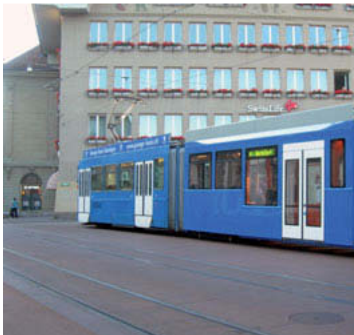
Zytligne: Nicht mehr länger Endstation für die Linie G.