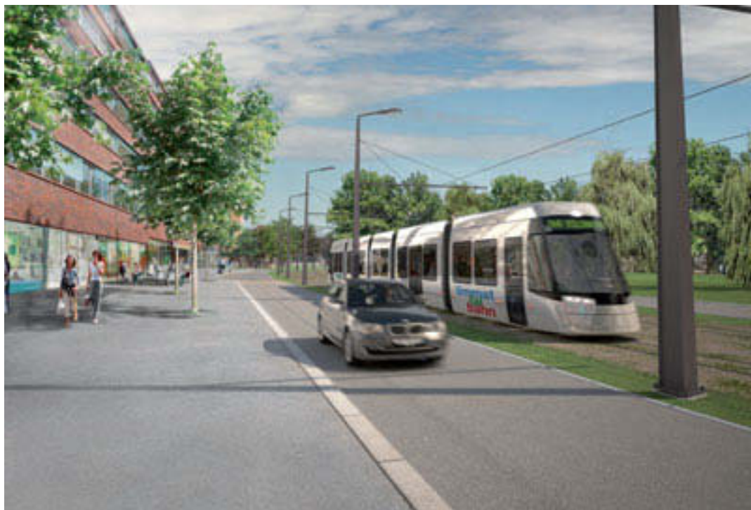
In Zürich steht mit der Limmattalbahn schon das nächste Projekt an.

Alle drei Minuten ein Gelenkbus oder alle sechs Minuten ein Tram? Keine Frage, das Tram ist effizienter, schneller, bequemer und belastet die Umwelt noch weniger als moderne Busse. In der Schweiz holt das Tram verlorenes Terrain zurück.