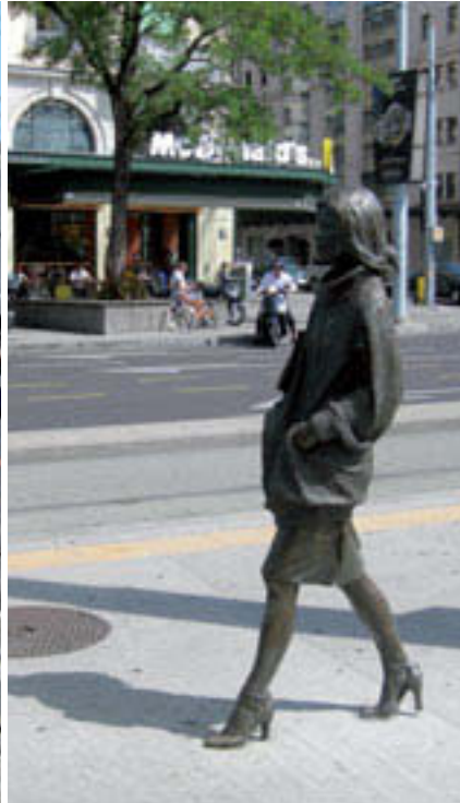
Plainpalais: Sie steigt immer um.