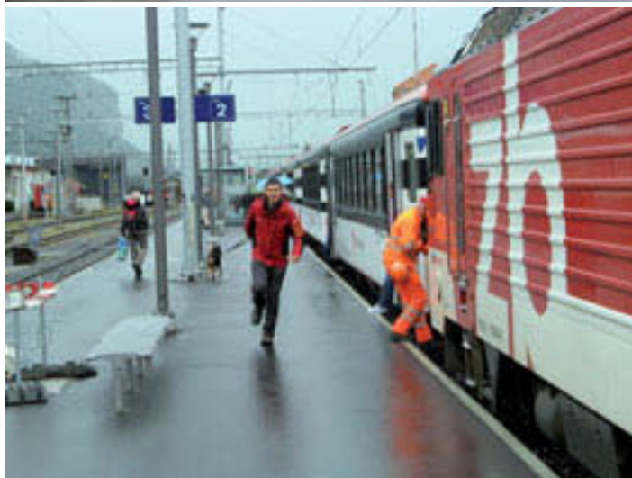
Meiringen: Spurten wegen Regen oder Umweg?