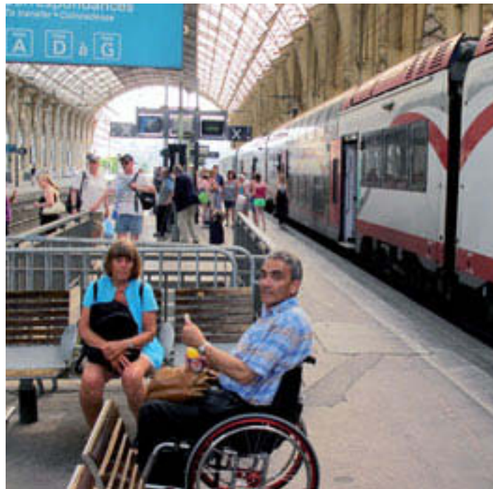
In Nizza sind auch Niederflureinstiege für Rollstuhlfahrer hoch.

Die Zwischenperrons sind – wie noch an den meisten Bahnhöfen im hexagone – sehr niedrig, was auch bei Zügen mit Niederflureinstieg für Rollstuhlfahrer zu Problemen führt. Da wurde offensichtlich seit fünfzig Jahren kaum mehr etwas gemacht. Ich habe einem Beamten gesagt, hier herrsche, trotz Behin-