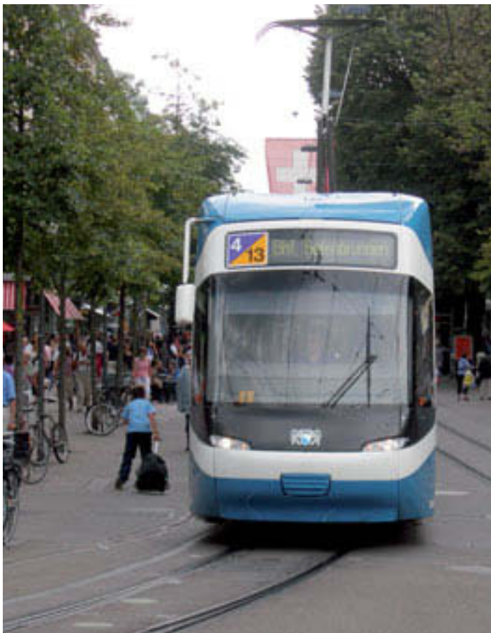
Speziallinie 4/13 während des Umbaus Escher-Wyss-Platz für Tram Zürich-West.