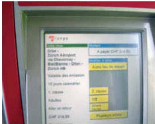
Oben: Zürich-Flughafen: bei Travys in Orbe sogar im Zug erhältlich. Rechts: In Champéry akzeptiert der Automat nur Noten und Münzen, ist aber für Kreditkarten vorbereitet.

Mit dem «Direkten Verkehr» kennt die Schweiz ein weltweit einzigartiges öV-Tarifsystem. Dieses ist rein als Streckentarif von einem Bahnhof zum anderen aufgebaut. Die Preisbildungsmechanismen der Verkehrsverbunde mit ih-