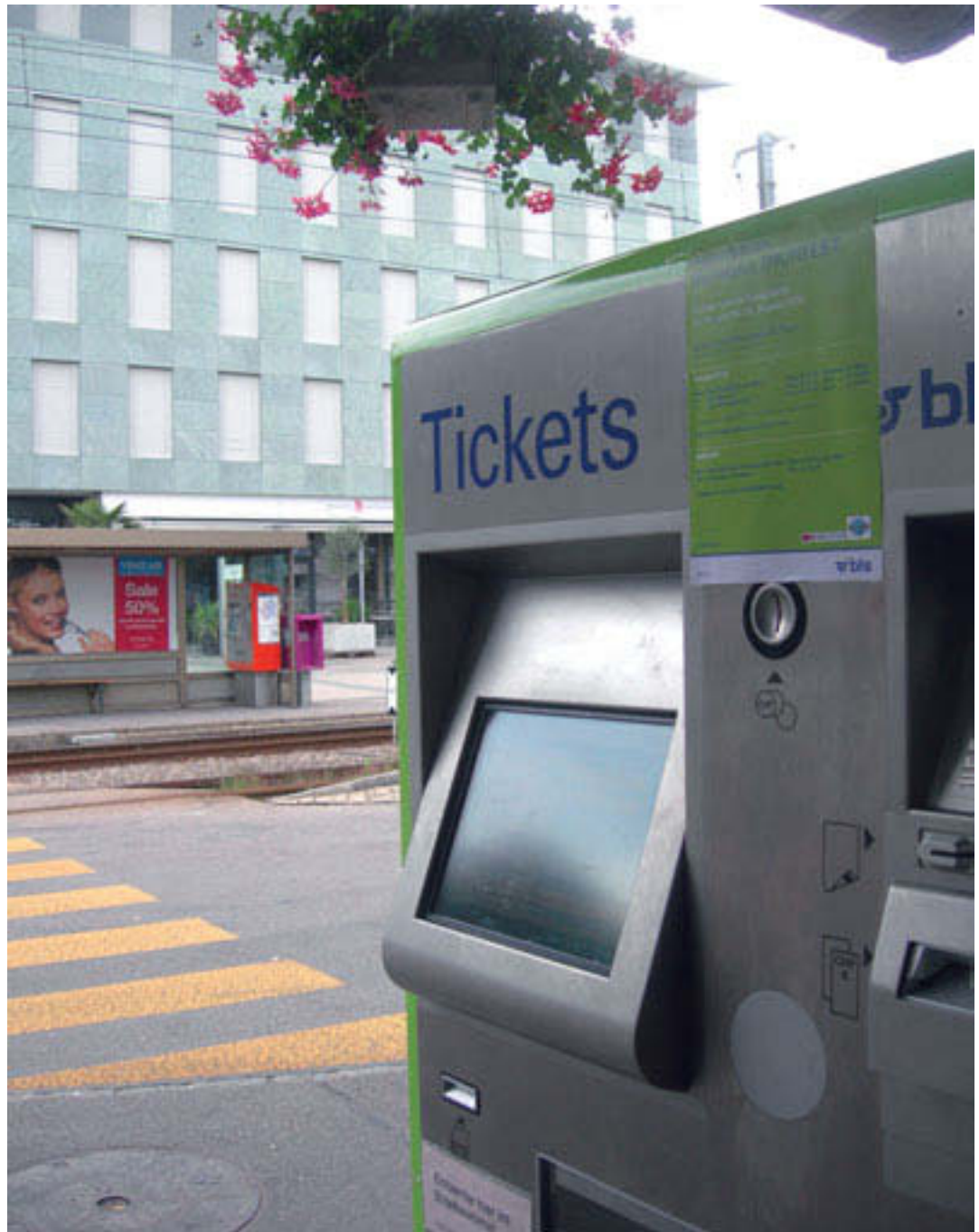
Gümligen SBB: unterschiedliche Libero-Automaten BLS grün und RBS orange.

In Bercher, Gros de Vaud, stehen Original-SBB-Billettauto-