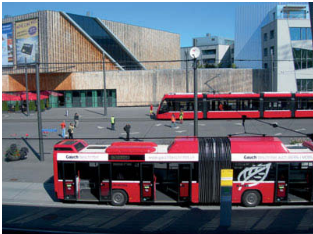
Bern Brünnen mit Zentrum Westside: Tram 8 löst Bus 14 ab. Erste Testfahrt Tram Bern West, 1.9.2010.