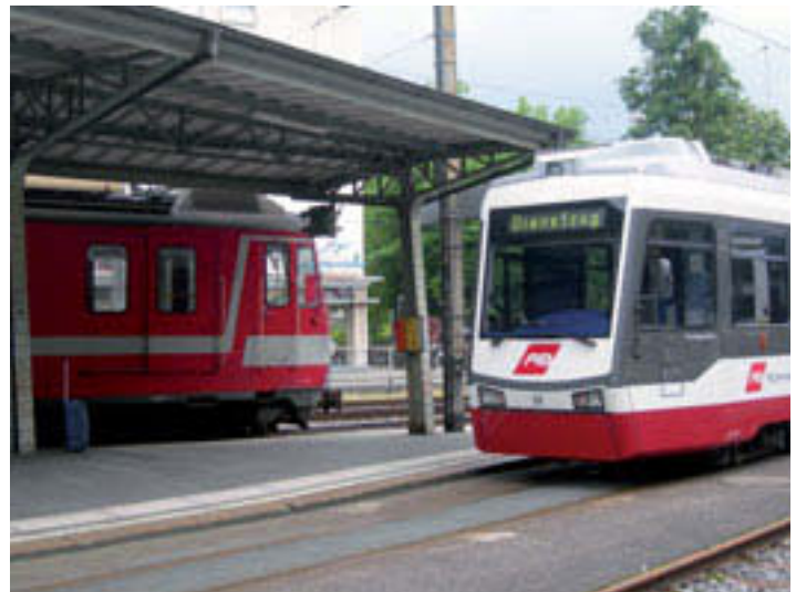
St. Gallen: Gaiser-Bahn und Trogener-Bahn werden durchgehend.

die Linie der AB aus Teufen-Gais noch in engen Kurven an der Zahnstange in die Stadt hinab und endet westlich des Zentrums im sogenannten Nebenbahnhof. Da bleibt man ja abgehängt. Hier endet auch die Trogenerbahn, welche östlich der Stadt als eine der steilsten Vorortbahnen Richtung Speicher die Appenzeller Hängel erklimmt. Dass dem nicht mehr so sei, ist eine Durchmesserlinie geplant. Die beiden Linien sollen verbunden werden, die Zahnstangenstrecke durch einen Tunnel ersetzt und die technischen Normalien vereinheitlicht werden. Mit 50 m langen Zügen, analog der Zürcher Forchbahn, wird zwischen Teufen, St. Gallen und Trogen ein 15-Minuten-Takt angeboten. Nicht ganz ein Trambetrieb, aber doch ein besseres Angebot als heute. Der Baubeginn ist für 2012 geplant und Ende 2015 soll die neue Linie in Betrieb gehen. Das St. Galler Tram führte einstmal von Neudorf