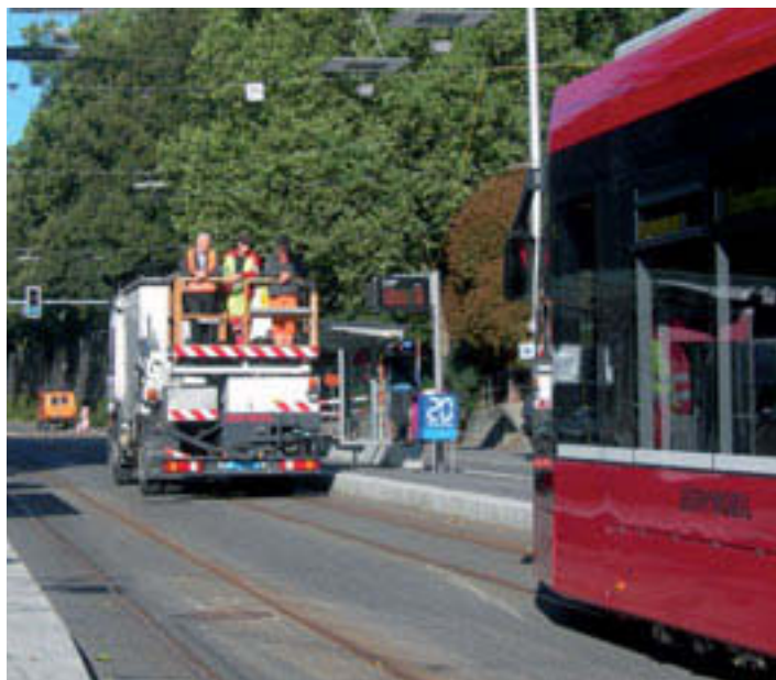
Stimmt die Fahrleitung? Scharf beobachtete Testfahrt. Das neueste Tram von Bern Mobil, Combino 666, gibt sich die Ehre Richtung Bern West.

wie Rüti, Bahnhof Ostermündigen, Eigerplatz und durch die Innenstadt die optimale Linienführung gesucht. Im Mitwirkungsverfahren wurde die Bevölkerung um deren Meinung gefragt. PB-EM konnte in der Begleitkommission Einsitz nehmen und Anliegen direkt einbringen. Unser Augenmerk galt sehr gezielt der Innenstadt, wo es sich herausstellte, dass aus Kundensicht die Linie am besten über die bestehenden Gleise in Markt- und Spitalgasse führt. In den engen Gassen muss dafür