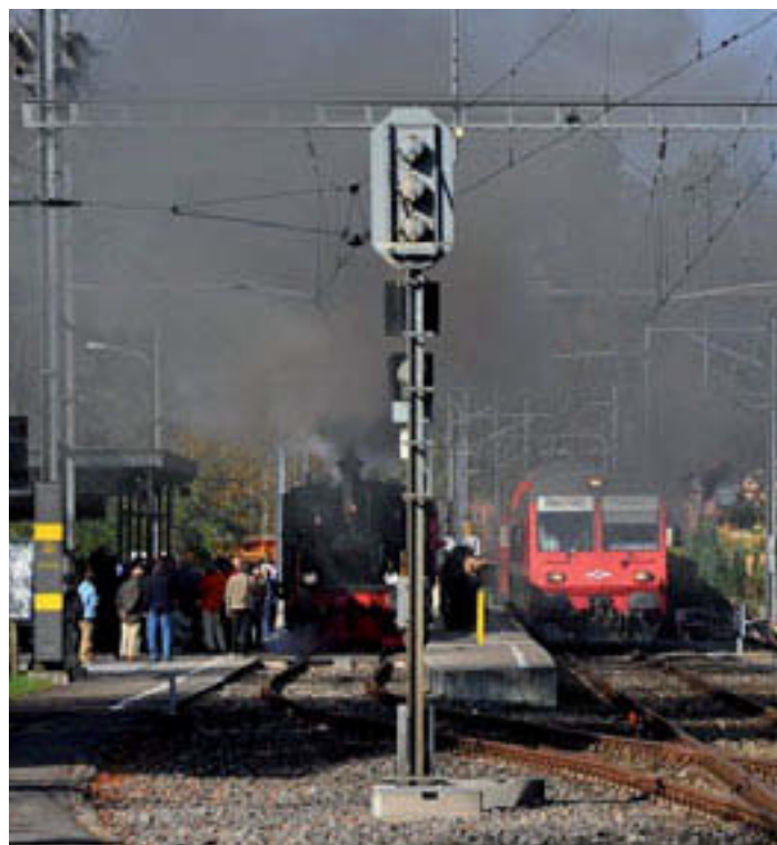
Bahnhof Sihlwald für Nostalgiker und Campierende Richtung Street Parade. Bild: ZMB

Samstagmittag, 13 Uhr, Bahnhof Sihlwald im hinteren Sihltal, der einmal pro Stunde von einem Zug angefahren wird. In unmittelbarer Nähe mehrere Campingplätze, von dorthin strömen Dutzende von Ravern und Raverinnen zum Bahnhof, wollen ein Billett kaufen, um nach Zürich zu gelangen. Vorhanden sind ein ZVV-Automat und ein zufälligerweise zur Abfahrt bereitstehender Nostalgiezug mit einem uniformierten