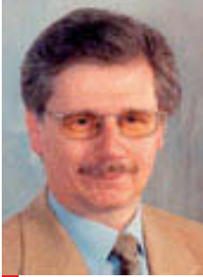
Edwin Dutler Präsident Pro Bahn Schweiz