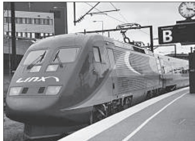
Albtraum für Kunden: Wer in Kopenhagen den Linx-Zug auf dem Vorbahnhof erreichen will, muss einen Fussmarsch von 300 Meter auf sich nehmen.

bahnverkehr angeboten werden soll, entscheiden die schwedischen und norwegischen Staatsbahnen, die Züge ab 2005 wieder unter der eigenen Flagge fahren zu lassen.