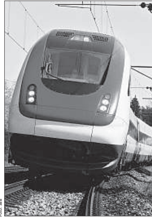
Keine Zeit, in Lenzburg zu halten: ICN auf der Jurasüdfusslinie.