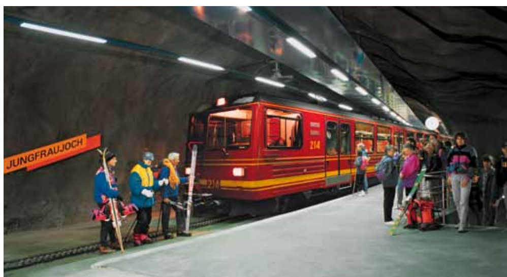
Top of Europe: Der höchste Bahnhof Europas liegt 3454 Meter über Meer.