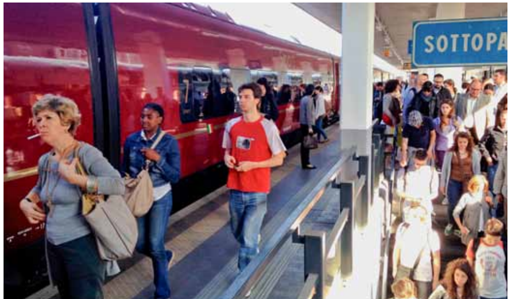
Der „Italo“ steht im Bahnhof Milano Garibaldi zur Abfahrt nach Roma Tiburtina bereit.