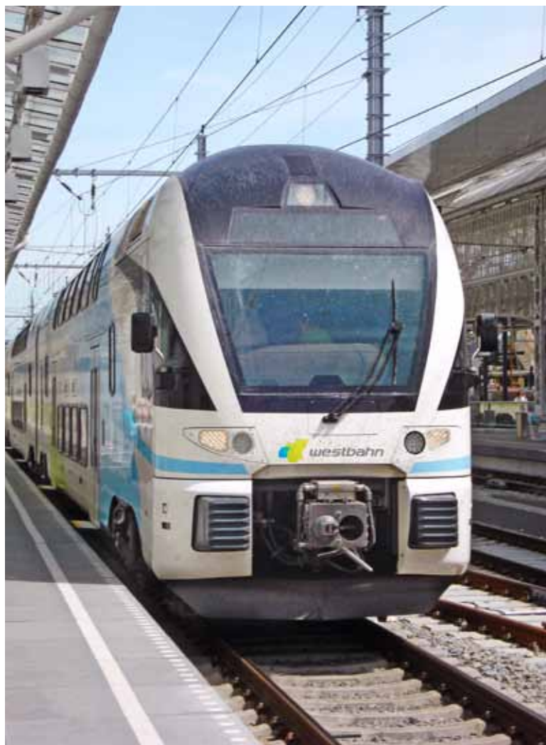
Neue Westbahn: Gewisses Mass an Intimität.