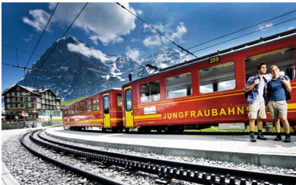
Kleine Scheidegg: Hier beginnt die spektakuläre Fahrt der Jungfraubahn durch die Eiger-Nordwand.

1894 erhielt Guyer-Zeller die Konzession, nachdem durch eine medizinische Expedition ins Hochgebirge bei Zermatt nachgewiesen worden war, dass der Betrieb einer Bahn in solchen Höhen den Fahrgästen keine gesundheitlichen Nachteile brachte. Nach dem Baubeginn 1896 wurde die Bahn stückweise in Betrieb