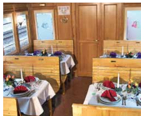
Das liebevoll dekorierte „Spiiswägeli“ wartet auf seine Gäste.