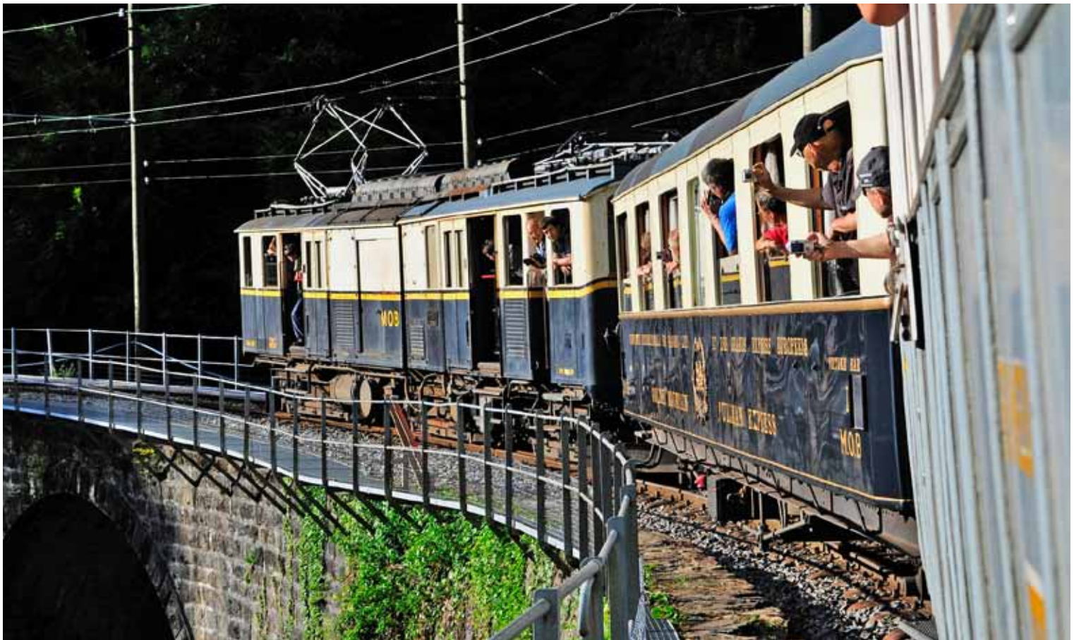
MOB 2002 et voiture salon-bar Pullman sur le Viaduc – Gepäcktriebwagen 2002 und Salonwagen auf dem Viadukt.