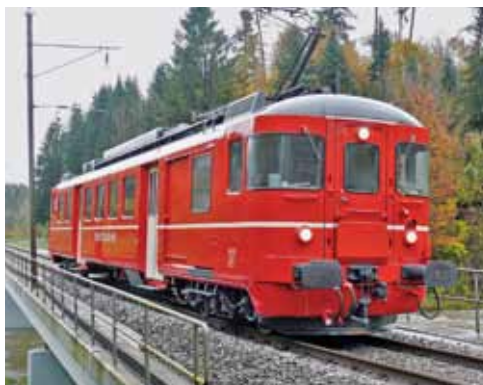
Der Triebwagen 92 wurde mit Respekt, historischer Sorgfalt und grösserem finanziellen Aufwand dem neuen Zweck – himmlische Fahrten anzubieten – angepasst.

Im „Spiiswägeli“ der ZMB können die frisch zubereiteten kulinarischen Köstlichkeiten aus dem mitfahrenden, topausgerüsteten „Chuchiwage“ genossen werden. Im umgebauten Original-Sihltal-Bahnpostwagen Fz 54 aus dem Jahre 1898 ist eine topmoderne Küche eingebaut, die es unseren Catering-Teams erlaubt, qualitativ hochstehende Gerichte frisch zuzubereiten. Aus der reichhaltigen Menükarte kön-