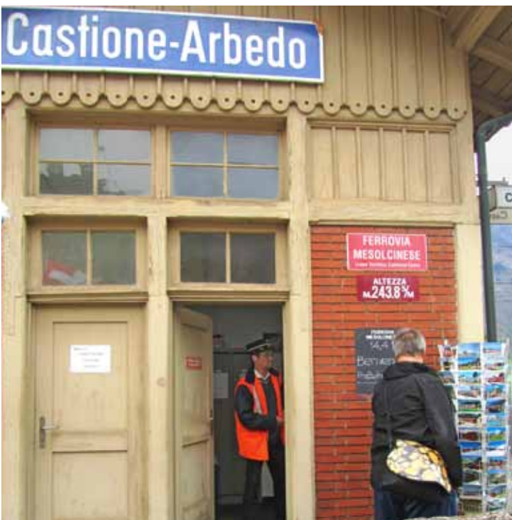
Bahnhof der FM in Castione mit Shop.