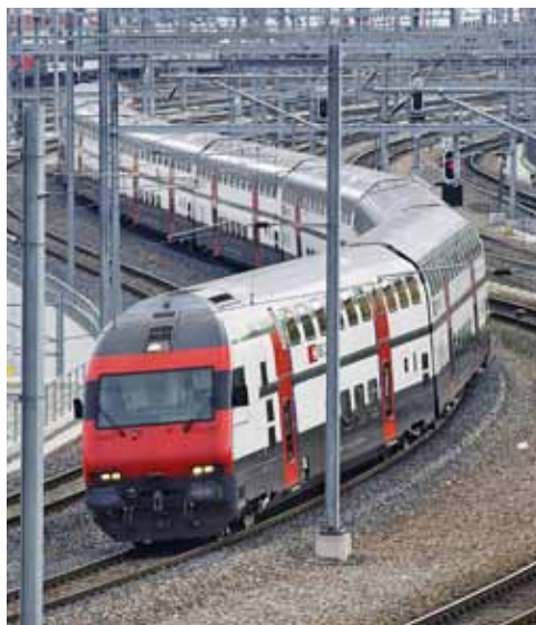
Die Schweiz als Vorbild.

Seit Jahren investiere der Bund in Deutschland um ein Vielfaches mehr Geld in die Strasse als in die Schiene, kritisiert Flege. Beispiel Netzausbau: Wie aus Zahlen der EU-Kommission hervorgeht, ist das Eisenbahnnetz der 27 EU-Staaten im Laufe der letzten zehn Jahre um 2,2 Prozent kürzer geworden. Im gleichen Zeitraum wuchs das europäische Autobahnnetz um 22 Prozent. Und auch hier rangiert Deutschland eher auf den hinteren Rängen: Mit einem Minus von 7,9 Prozent beim Netzausbau der Bundesschienenwege liegt Deutschland an drittletzter Stelle – nur Polen (minus 12,4 Prozent) und Lettland (minus 19,2 Prozent) schrumpften ihre Schieneninfrastruktur von 2000 bis 2009 noch stärker als Deutschland. Dagegen setzen viele Staaten in der Europäischen Union ganz bewusst auf ein Wachstum ihrer Eisenbahntrassen, zum Beispiel Spanien (plus 8,5 Prozent), Italien (plus 5,0 Prozent) oder Belgien (plus 3,1