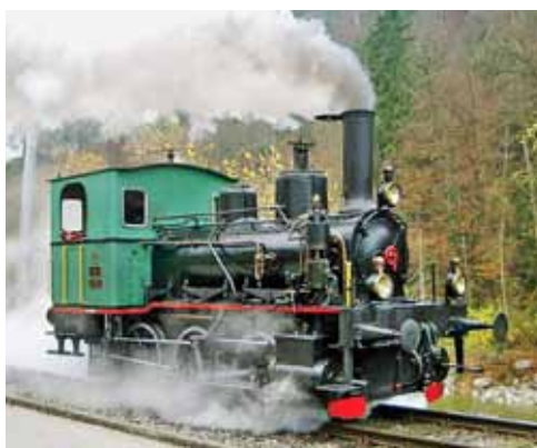
„Hansli“ war die Dampflokomotive Nr. 2, die von der Sihltalbahn 1893 beschafft wurde.

nen Köstlichkeiten ausgesucht werden, die zum Anlass passen. Bei öffentlichen Fahrten werden saisonale Menüs angeboten. Das gemütliche „Spiiswägeli“ aus dem Jahr 1892 wurde 1999 restauriert und bietet an gemütlichen Zweier- und Vierer-Tischen Platz für 32 Personen.