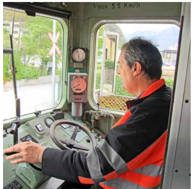
„Es darf auch langsamer sein!“