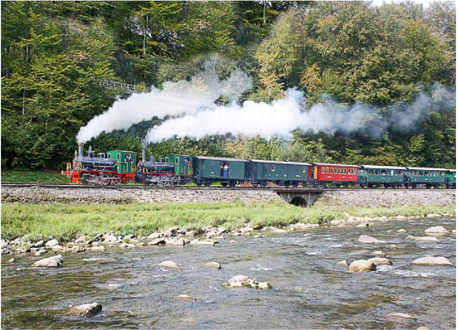
Schnaaggi-Schaaggi und Hansli in Doppel-Traktion (September 2011).