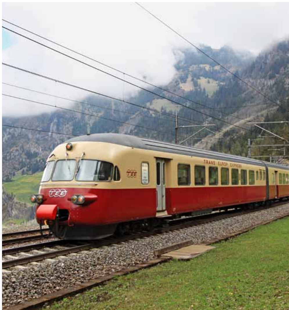
Trans-Europ-Express: Sinnbild für Reiselust und Luxus.

Insgesamt verkehrten fünf TEE-Kompositionen der Baureihe SBB RAe TEE II auf dem europäischen Schienennetz. Die Züge standen während fast vierzig Jahren im fahrplanmässigen Einsatz – ab 1988 fuhren sie in veränderter Aufmachung als EuroCity –, bis sie 1999 aus dem fahrplanmässigen Verkehr gezogen wurden.