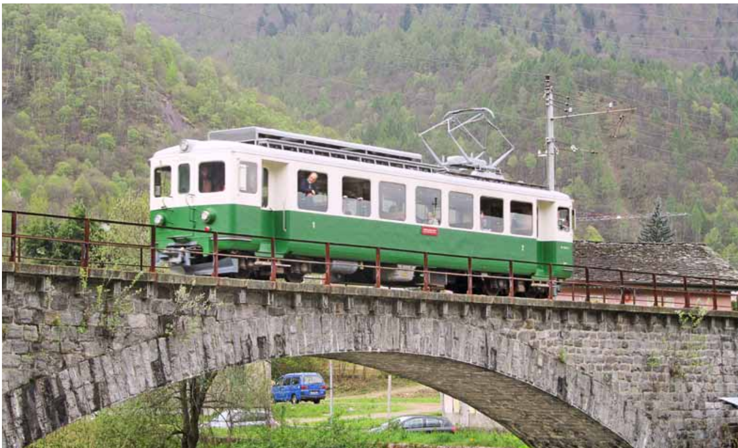
Unterwegs im Misox: Ein restaurierter Triebwagen der einstigen Bahn Biasca-Aquarossa in Roveredo GR.