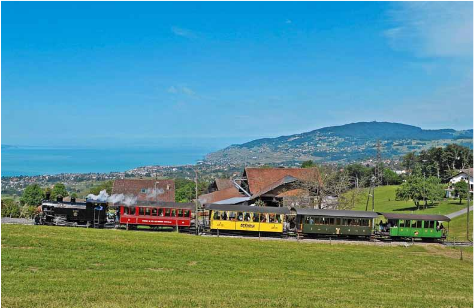
BFD 3 (Brig-Furka-Disentis) de passage à Cornaux avec vue sur le Lac Léman – BFD 3 bei Cornaux mit Blick auf den Genfersee.