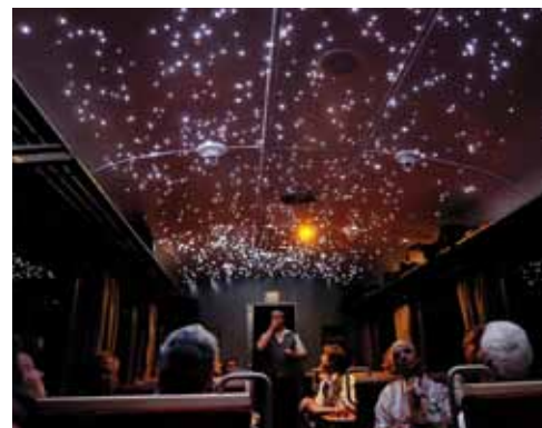
Blick in den abgedunkelten Passagierraum des Tw92; der südliche Fixsternhimmel wurde mit 1447 Sternen in 6 Grössenklassen nachgebildet.

Der Autor ist Vizepräsident der ZMB Zürcher Museums-Bahn