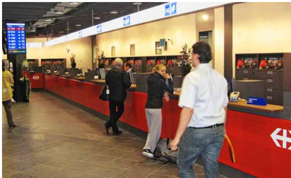
Hell, freundlich, geräumig: Das neue Reisezentrum der SBB in Bern.

30 Prozent aller Billette werden schweizweit immer noch im bedienten Verkauf abgesetzt.