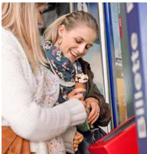
Billette: Im Inland geht's leicht.

Als der Spuk dann endlich vorüber war, verlangte das EU-Parlament vom EU-Verkehrskommissar Siim Kallas konkrete Massnahmen und Verbesserungen im Eisenbahnverkehr. Aber der arme Slim Kallas hat ja vom europäischen Eisenbahnverkehr keine Ahnung. Er kommt aus Estland, das nach der Erlangung der Unabhängigkeit das gesamte Bahnnetz an amerikanische Finanzgesellschaften verkauft hat. Und diese sorgten dann wie in Neuseeland dafür, dass durch Nichtinvestitionen das Netz nach einigen Jahren total am Boden war und durch den Staat wieder zurückgekauft werden musste. Heute funktioniert wieder ein Ansatz von Güterver-