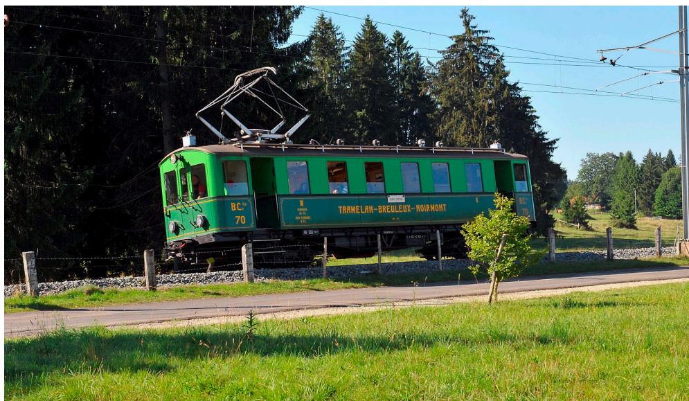
Historischer Triebwagen der Chemins de fer du Jura CJ.

Nützliche Internetadressen: www.juratourisme.ch ; www.paysan-horloger.ch ; www.la-gruyere.ch ; www.tpf.ch ; www.la-traction.ch .