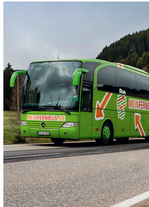
Geben Anlass zu heftigen Diskussionen: Die neuen Fernbusse.

Pro Bahn Schweiz plädiert für das bisherige Nebeneinander zwischen Schiene und Strasse und erachtet derartige Absichten als kurzfristig oder gar als Schnitt ins eigene Fleisch.