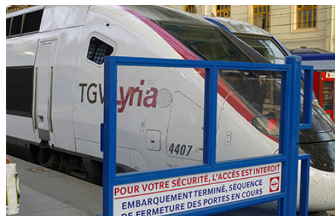
Fährt neu von Genf bis Lille: TGV Lyria.

Die TGV-Linie Lausanne–Paris wurde 1984 in Betrieb genommen. Weitere Linien ab der Schweiz nach Paris, zum Beispiel ab Bern–Neuenburg, folgten. Später wurden diese durch Züge ab Genf Richtung Montpellier, Marseille und Nizza ergänzt. Ab Fahrplanwechsel in diesem Dezember fährt TGV Lyria neu bis in den Norden Frankreichs; mit einem Zug von Genf nach Lille mit Halten in Eurodisney und am Pariser Flughafen Charles-de-Gaulle. Die Aktivitäten der französisch-schweizerischen Betreibergesellschaft seien in den letzten Jahren stark