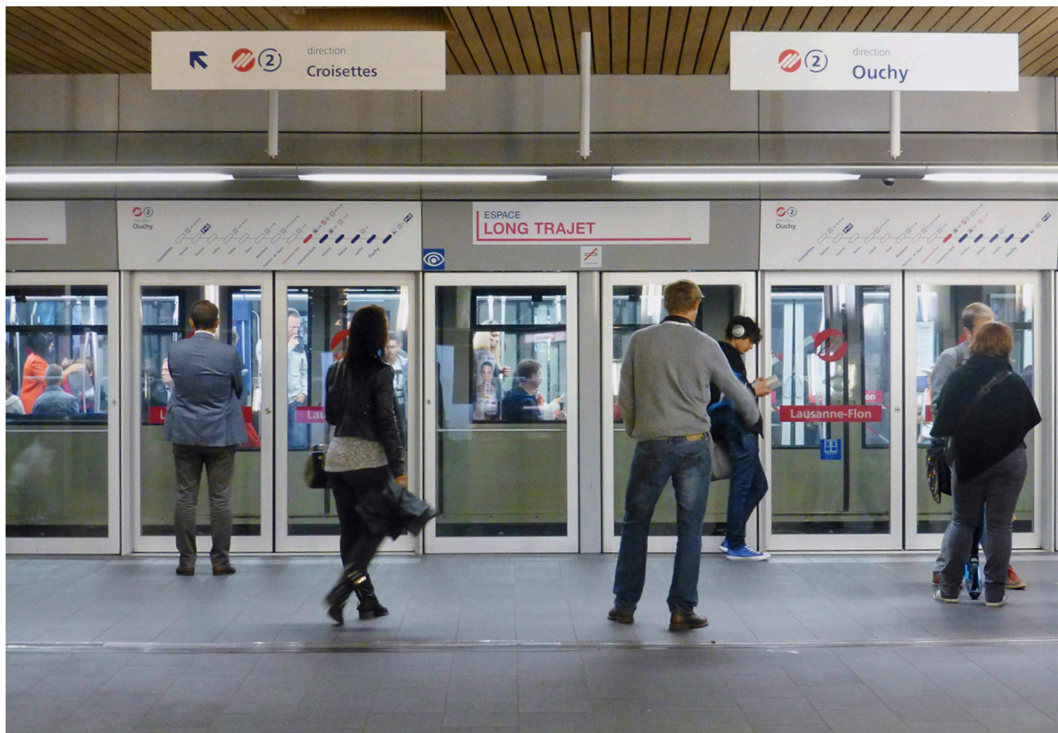
Beispiellose Erfolgsgeschichte: Die vollautomatische Metro M2 in Lausanne.