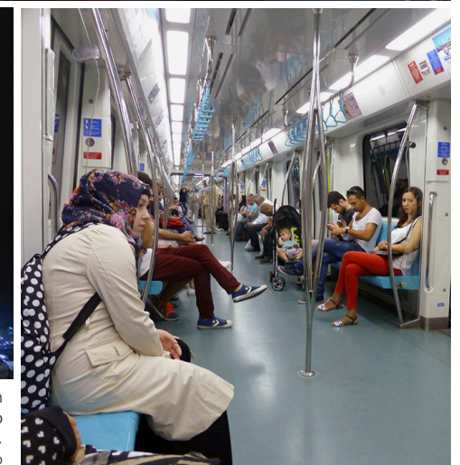
Haltestelle und Verkehrsknoten Eminönü im Zentrum von Istanbul (Mitte); das geräumige Innere der neuen Metro Marmaray; der ausrangierte Kopfbahnhof Haydarparascha.