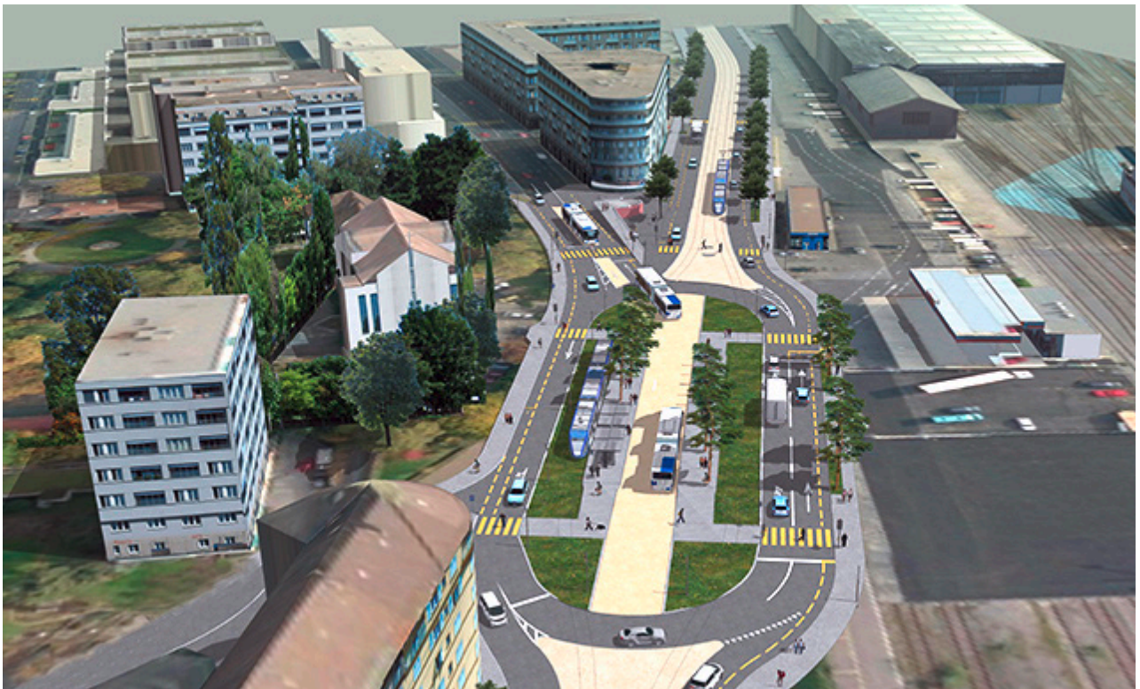
Haltestelle Prélaz-les-Roses: Knotenpunkt für Tram und Hochleistungsbusse.

sanne) erlaubt die Ankunft des Trams gemäss den 2014 geänderten Plänen, die öffentliche Fläche für Fussgänger und Veranstaltungen zu verdoppeln.