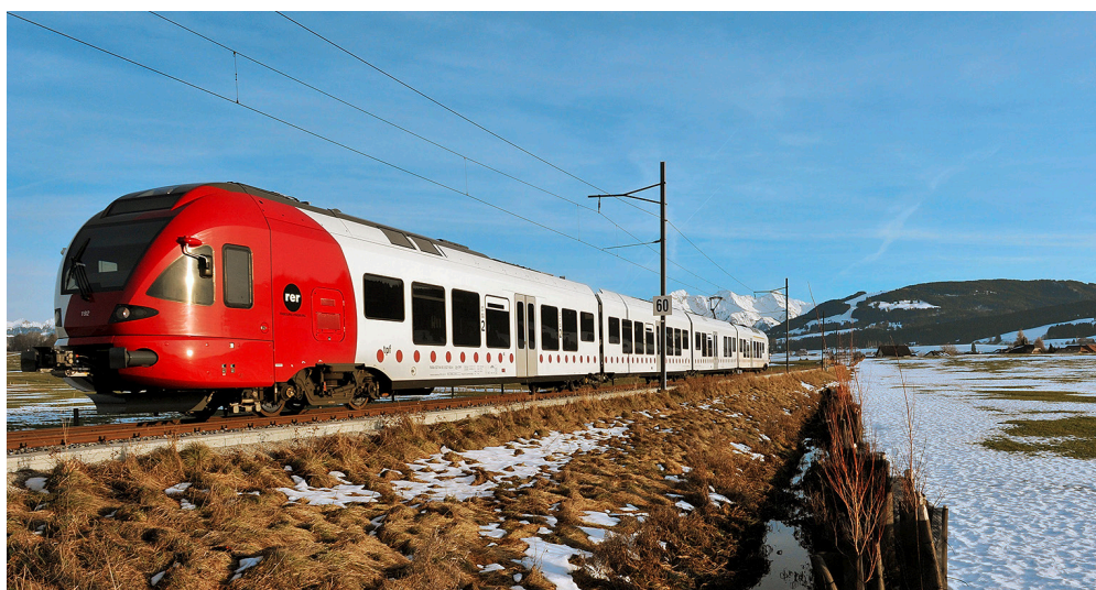
Modernes RER-Rollmaterial auf der Strecke Bulle–Freiburg.