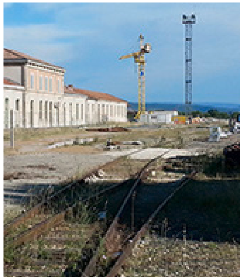
Tristesse pure: Gleisanlage in Carpentras (Südfrankreich).

Die Ursachen für diesen Niedergang sind vielfältig: In Frankreich herrschte zwischen 1880 und 1925 ein richtiges Eisenbahnbaufieber: Zahllose Strecken wurden ohne eine ausrei-