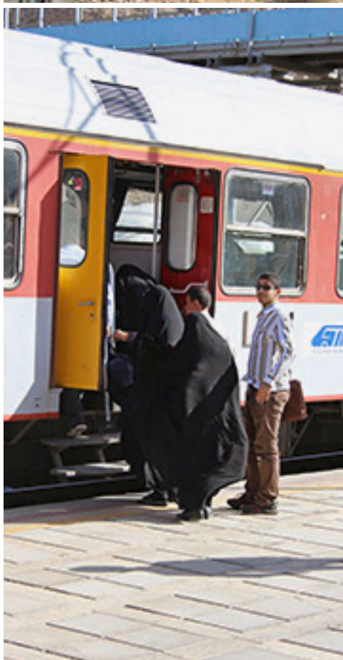
Dürfte bald UNESCO-Welterbe werden: die Bahnstrecke Teheran – Sari.

Die Nachtzüge werden ausschliesslich als 1. Klasse mit hohem Standard geführt. Die verwendeten Schlafwagen sind alle um 2009 aus China importiert worden. Alle grösseren Städte haben tägliche Nachtzugverbindungen nach Teheran. Dazu gibt es weitere direkte Städteverbindungen. Benutzt haben wir bei unserer Reise die Nachtfahrten Yazd – Mashad und Mashad – Teheran. Mehr Infos zu Iranrail und Zugverbindungen finden sich unter www.iranrail.net .