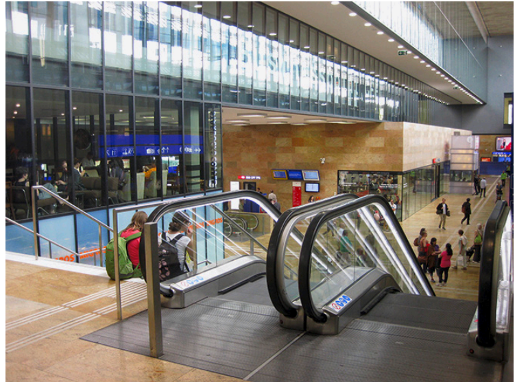
Lichtdurchflutet und freundlich: Osthalle in Genf Cornavin.

Die historischen Fassaden, Mauerfresken und die grosse Uhr wurden in Absprache mit dem Denkmalschutz restauriert. Nach Abschluss der Bauarbeiten am Bahnhofsgebäude steht nun die Erhöhung der Zugkapazitäten an. In Planung ist ein unterirdischer Ausbau des Bahnhofs Genf Cornavin mit zwei Gleisen für die künftige S-Bahn (CEVA) nach Annemasse.