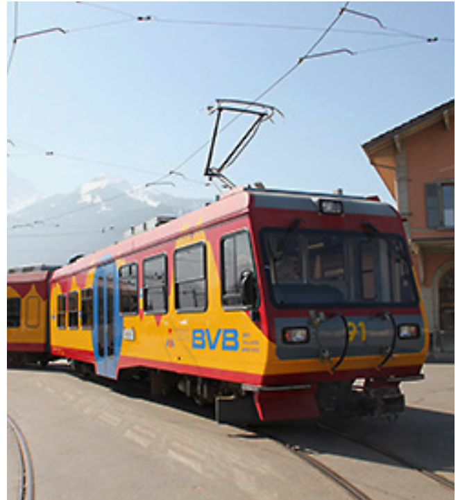
TPC-Züge im Bahnhof Aigle und ein BVB-Zug im Bahnhof Bex.