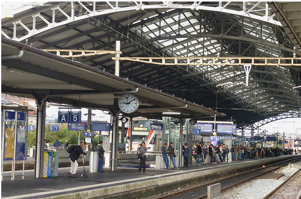
Soll im Rahmen des Projekts „Léman 2030“ erweitert und modernisiert werden: der Bahnhof Lausanne.

In Renens fiel der offizielle Startschuss für das Bahn-Ausbau-Projekt „Léman 2030“.