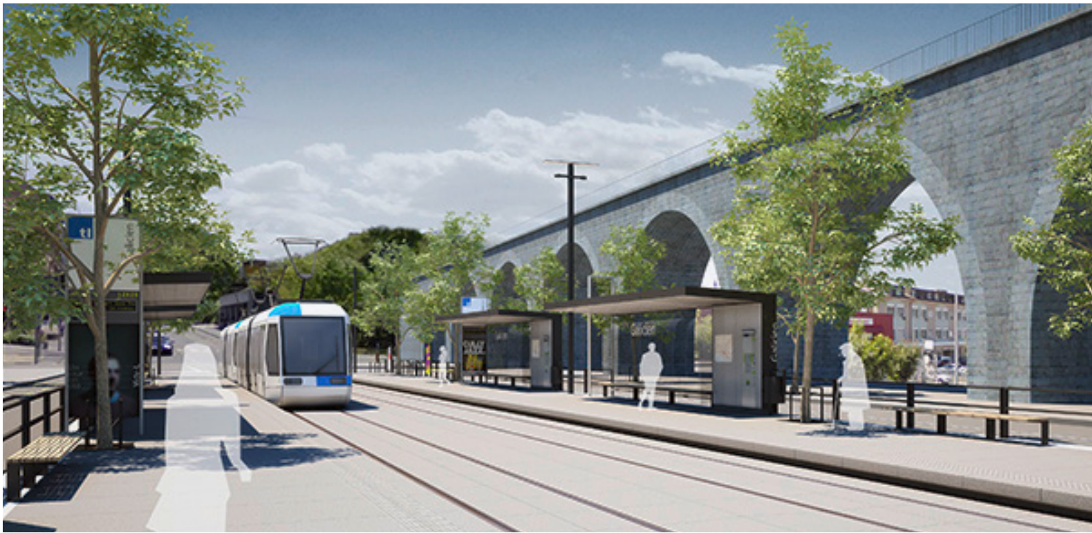
Tram t1 Renens–Lausanne-Flon: So wird sich die Haltestelle Galicien präsentieren.