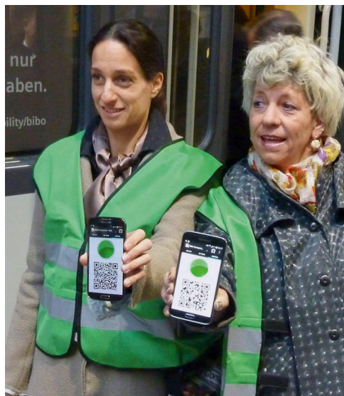
Bei innovativem „Ticketing“ hinken Schweizer öV-Unternehmen den technischen Entwicklungen hinterher.