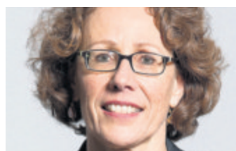
«Durch die Wechsel gibt es wieder neue Impulse.»

MATTHIAS STADLER matthias.stadler@luzernerzeitung.ch