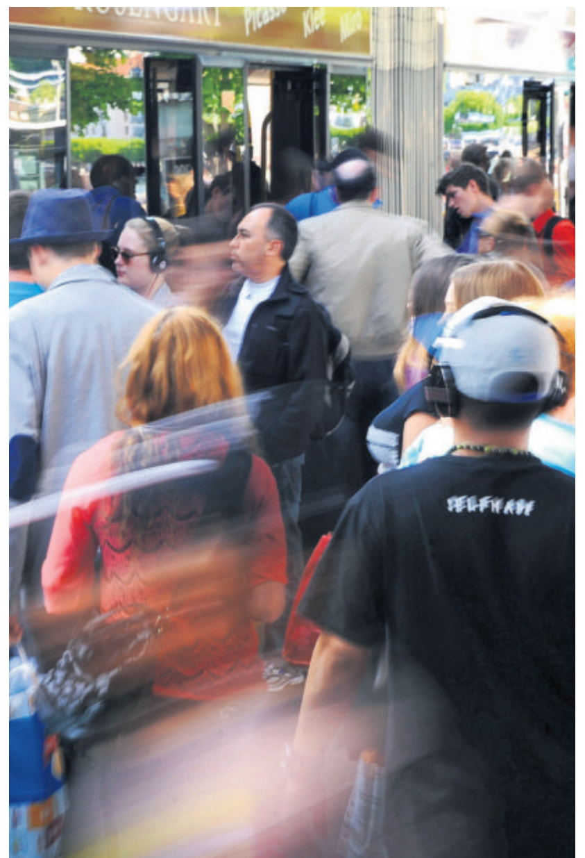
«Rushhour» auf einem Busperron am Luzerner Bahnhofplatz.

Grafik: web