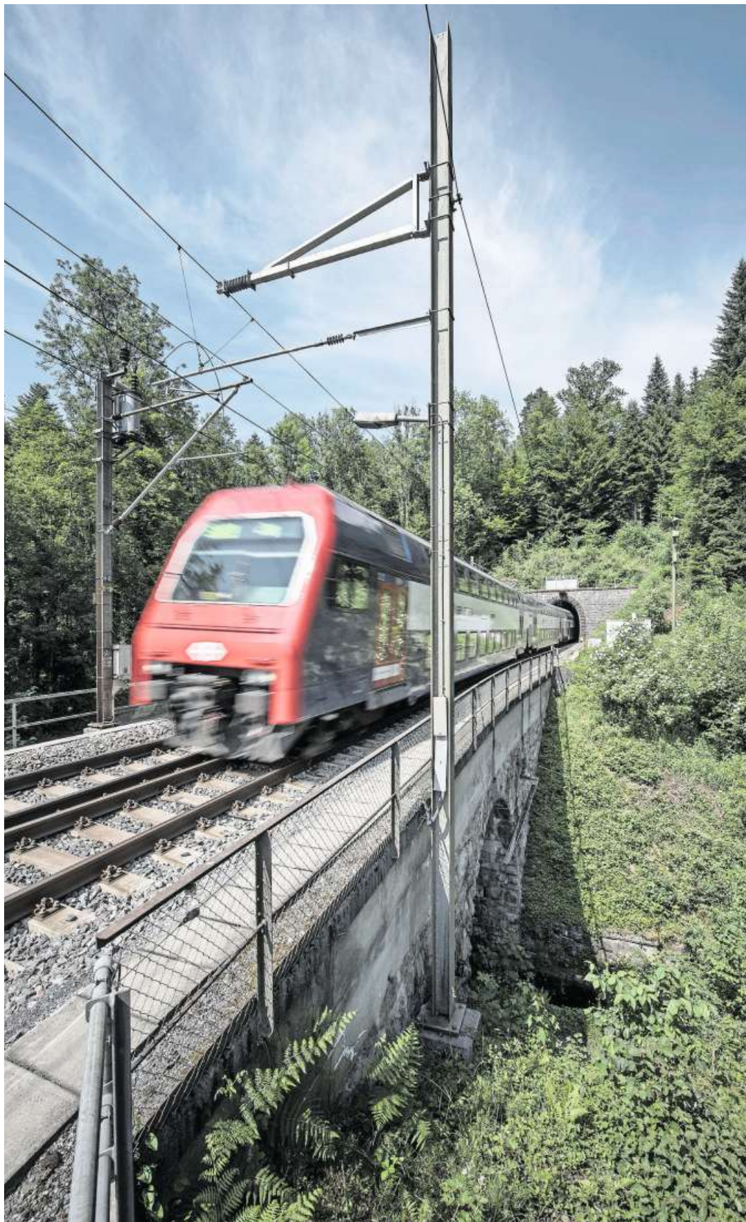
Eine S-Bahn auf dem einspurigen Abschnitt bei Sihlbrugg in Fahrrichtung Zug. Bild: Pius Amrein (13. Juni 2017)

Vorteil bei Zimmerberg light sei neben den Kosten, dass der Bau schneller realisiert sei als beim Basistunnel, er sei auch