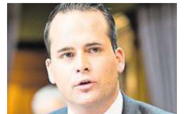
Damian Müller Luzerner Ständerat (FDP)

etappierbar. Zudem können die Züge weiterhin in Thalwil halten. Nachteil ist, dass der Fahrzeitgewinn nur 1 bis 2 Minuten beträgt (mit dem Basistunnel bis 6 Minuten) und der Bahnhof Thalwil ausgebaut werden muss. Dieser Ausbau ist in der Kostenschätzung des Komitees enthalten.