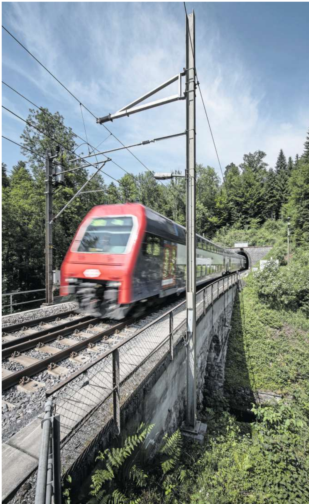
Eine S-Bahn auf dem einspurigen Abschnitt bei Sihlbrugg in Fahrrichtung Zug. Bild: Pius Amrein (13. Juni 2017)

Vorteil bei Zimmerberg light sei neben den Kosten, dass der Bau schneller realisiert sei als