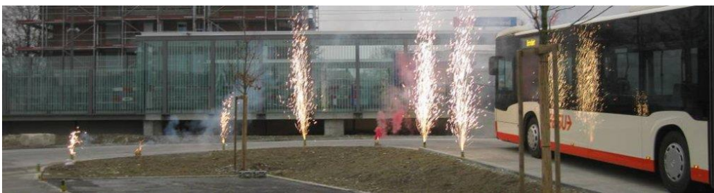
Haltestelle Solothurn Allmend mit neuer Buswendeschleife

Bahn und Bus treffen sich neu bei den Haltestellen Biel/Bienne-Bözingenfeld/Champs-de-Boujean (vb-Buslinie 2) und Solothurn Allmend (BSU-Buslinie 6). In unmittelbarer Nähe der Haltestelle Bellach (Ortsteil "Grederhof") soll am Burgweg eine neue BSU-Bushaltestelle Ende 2016 in Betrieb gehen.